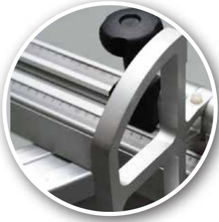
Tersçevrilebilir Dayama Siperi Cross Cutting Fence With Reversible Fence Stops

Tersçevrilebilir koruma durakları bulunur Large section profile cross cutting fence with reversible fence stops