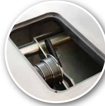
Ana Testere Devir Ayarı Quick Speed Change System

Tersçevrilebilir koruma durakları bulunur Large section profile cross cutting fence with reversible fence stops