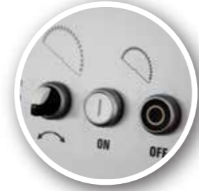
Motorize Açılı ve Yükseklik Ayarı (PS400) Motorised Blade Rising / Tilting