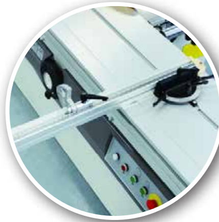
Açılı Kesim Aparatı Angled Cutting Device