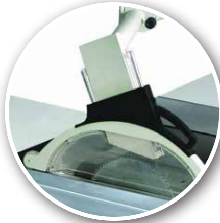
CE normunda Testere Muhafazası ve Toz Emme Ağızı CE type Overhead Saw Blade Guard